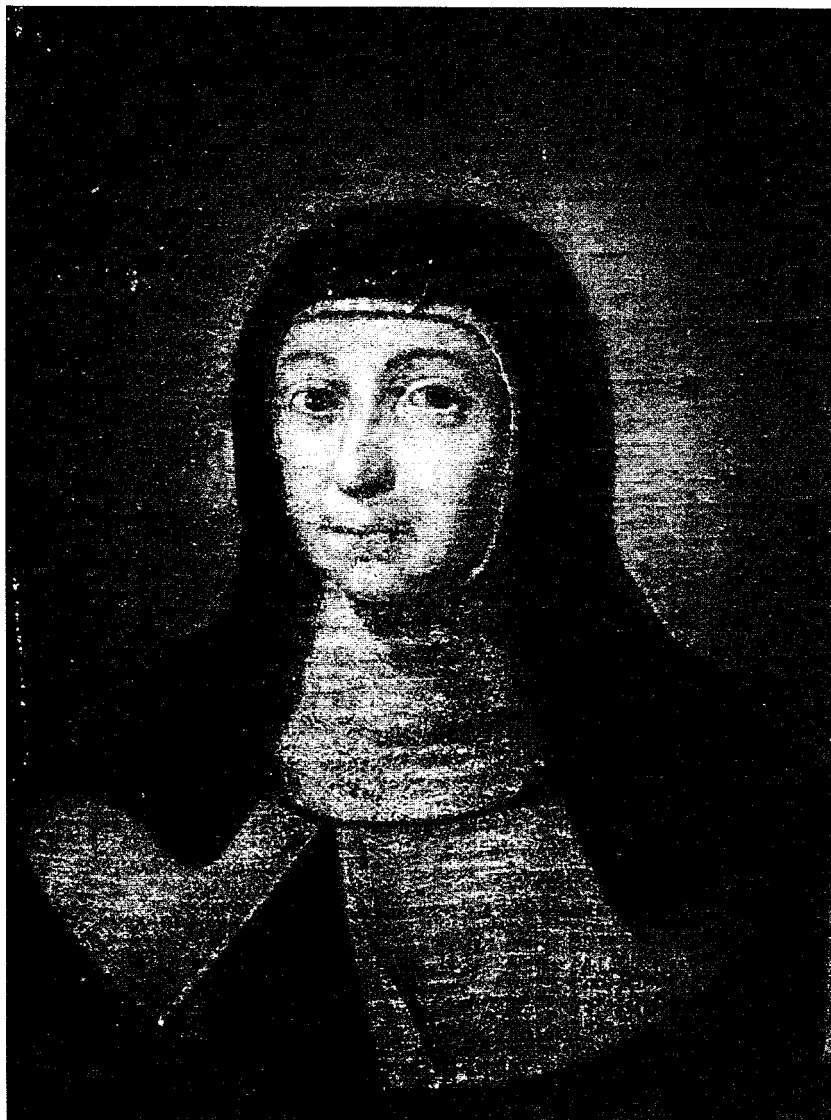
1. Malarz nieznany. Portret Marii Klary Wittelsbach, w zakonie siostry Teresy Marii od św. Józefa (1608–1652), karmelitanki bosej. 2 połowa XVII w. Kraków, klasztor karmelitanek bosych na Wesolej.